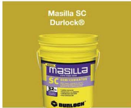
Masilla SC Durlock®