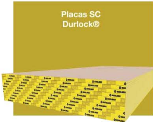
Placas SC Durlock®